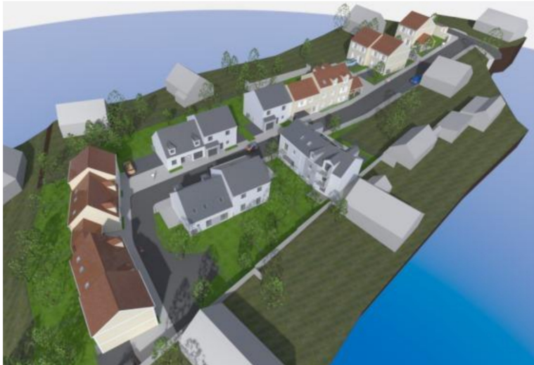
MAISON 2 non PMR + lot 31